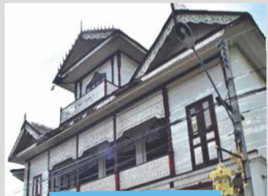
อาคารหม่องไถ่ยี่ซัน