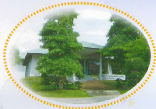
ศูนย์ชั่งตวงวัดภาคตะวันออกเฉียงเหนือ จ.ขอนแก่น Northeastern Verification Center (Khon Kaen)