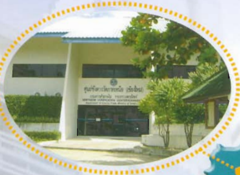
ศูนย์ชั่งตวงวัดภาคเหนือ จ.เชียงใหม่ Northern Verification Center (Chiang Mai)