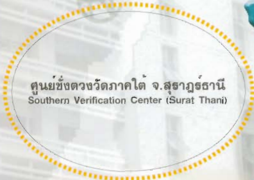
ศูนย์ชั่งตวงวัดภาคใต้ จ.สุราษฎร์ธานี Southern Verification Center (Surat Thani)