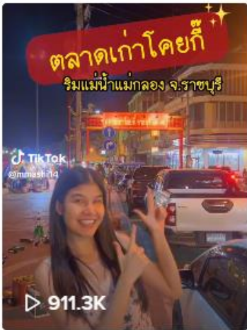
ตลาดเก่าโคยก็ ริมแม่น้ำ...

ช่อง @mmashi๑๔ โดยจัดทำเรื่อง ตลาดเก่า โคยก็ จ.ราชบุรี