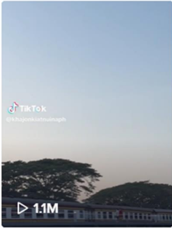
จุดเช็คอินที่ต้องห้ามพลาด...

ช่อง @khajonkiatnuiaph โดยจัดทำเรื่อง ถนนคน เดินเมืองเก่า อ.ปรางมบุรี จ.ประจวบคีรีขันธ์