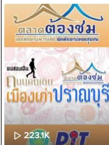
พาเที่ยวตลาดต้องชม ถนน...

ช่อง @suksan.za๔๘ โดยจัดทำเรื่อง ถนนคน เดินเมืองเก่า อ.ปรางมบุรี จ.ประจวบคีรีขันธ์