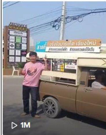
เข้านี้มาเที่ยวตลาด จริงใจ คร้...

ช่อง @angel_no๕๘ โดยจัดทำเรื่อง ตลาดจริงใจ มาร์เก็ต จ.เชียงใหม่ / การ ปิดป้ายราคาสินค้าและ บริการ / การสังเกตเครื่องชั่ง