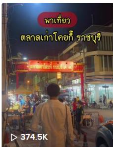
พาเที่ยว "ตลาดเก่าโคยก็ รา...

ช่อง @guyygyuyy โดยจัดทำเรื่อง ตลาดเก่า โคยก็ จ.ราชบุรี