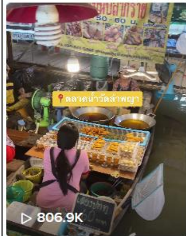
📍 พิกัด #ตลาดน้ำลำพญา ...

ช่อง @analinnisa โดยจัดทำเรื่อง ตลาดน้ำ วัดลำพญา จ.นครปฐม