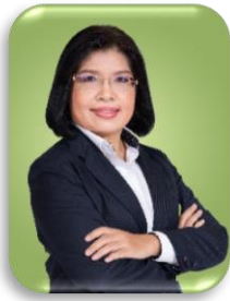
นางอรมน ทรัพย์ทวีธรรม อธิบดีกรมเจรจาการค้าระหว่างประเทศ